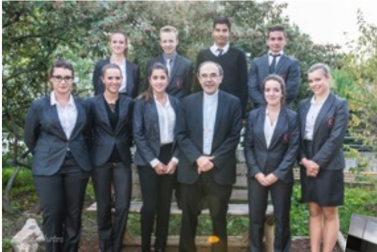
Rencontre avec les 2 de CSR

Visite Pastorale de Mgr Barbarin le 1 er octobre 2015