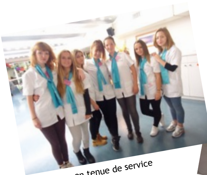
en tenue de service

La classe de 1 er ASSP à Lourdes au service des malades pendant le pèlerinage du Rosaire du 6 au 11 octobre 2015