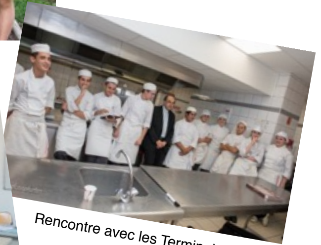
Rencontre avec les Terminale Cuisine

La classe de 1 er ASSP à Lourdes au service des malades pendant le pèlerinage du Rosaire du 6 au 11 octobre 2015