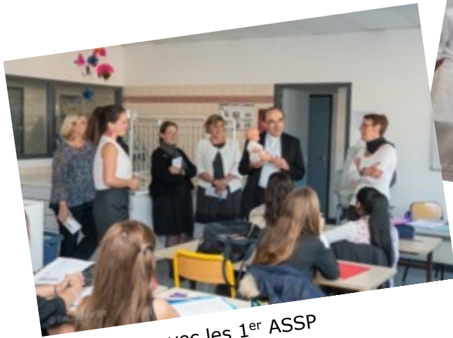
Rencontre avec les 1 er ASSP